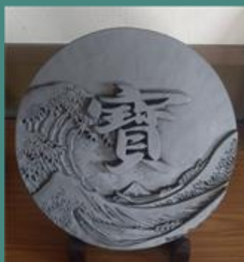
《富嶽36景》神谷寿(鬼栄)