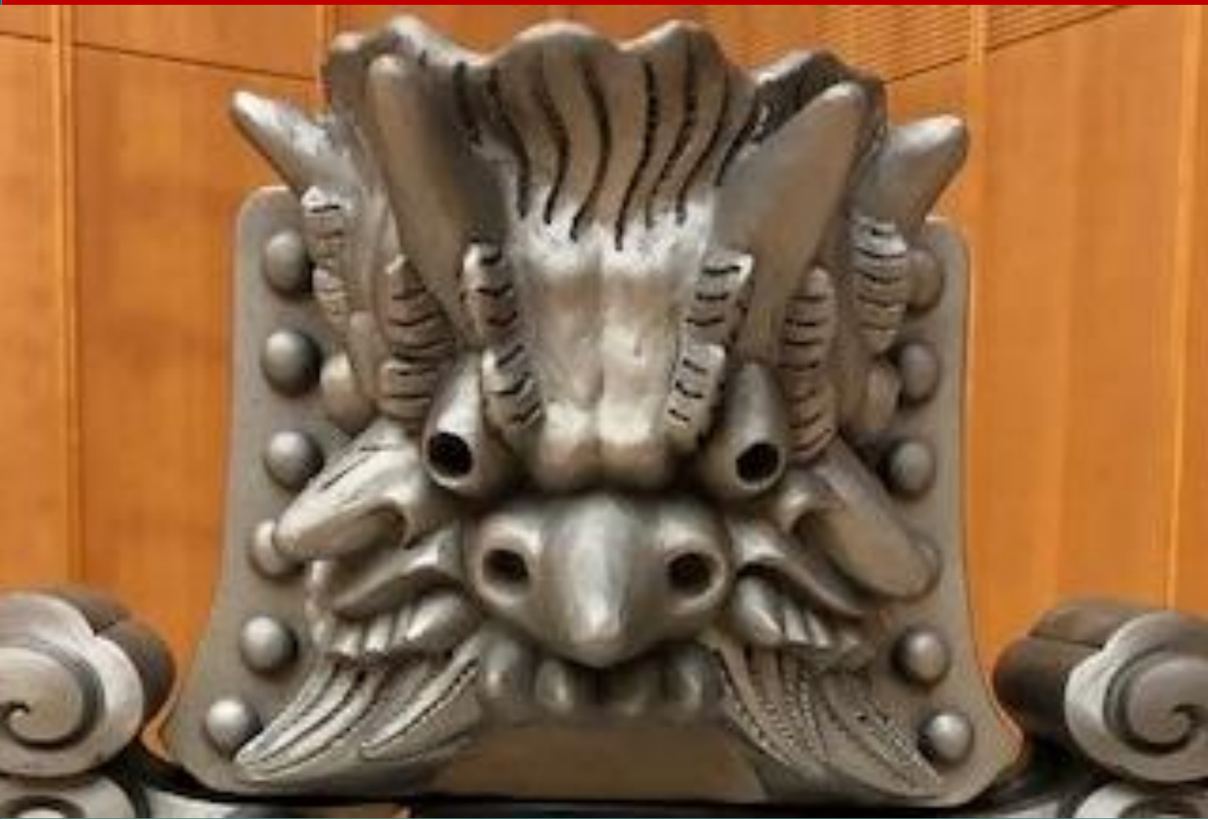
《三面鬼面》加藤宜高(丸市)