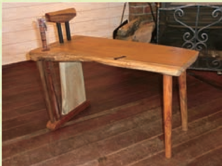
靴べら立付き椅子