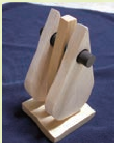
カッティングボード