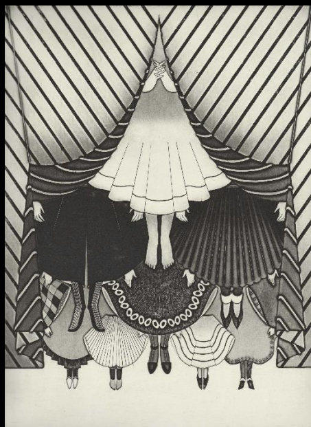
『Aはきれいな服をきる』