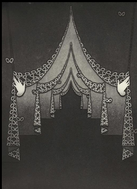
『Aはとくで歌うたう』