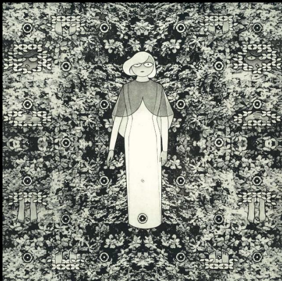
『浮遊する人#7 いい思い出になる頃合い』