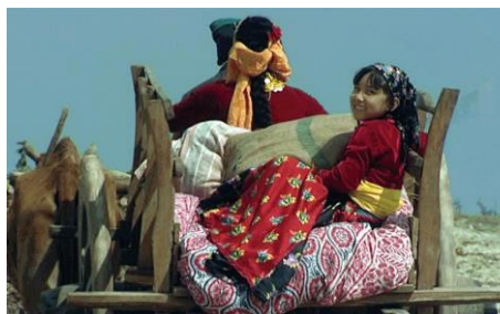
(c) 伊藤敏朗, 2008

【物語】ネパールの山あいの村に、牛にひかれて一台の荷車が峠を越えてやってくる。乗っているのは人形芝居の夫婦であった。村で開かれた祭りに、カトマンズから一時帰省していたラメスが祖母のマヤに手をひかれてやってくる。ラメスは祭りの人形芝居に不思議と心を奪われるのであった。