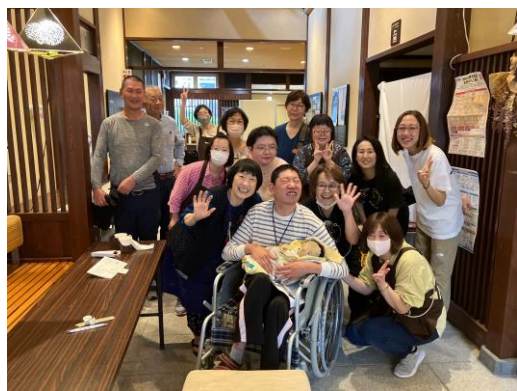
禅の里交流館「ふれあい喫茶」にて

これまで、沢山の支援を受けながら乗り越えて来ましたが、それぞれの家庭や施設が災害に対応できる準備をしておく必要があることを痛感いたしました。また支援を有効に生かすには、受ける側の能力が必要（受援力）であることも学びました。 終わりに、皆様方の多くのご支援に深く感謝を申し上げます。有難うございました。