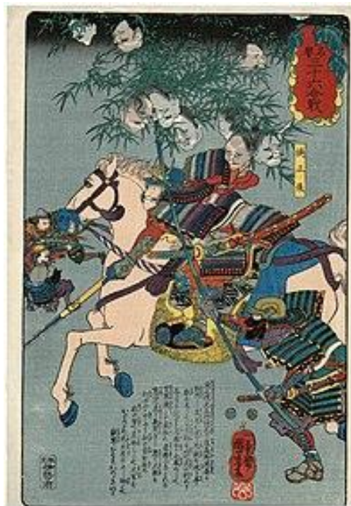
『名誉三十六合戦』より『楠正儀』 歌川国芳

康安元年 (正平 16 年、1361)、足利幕府内での抗争で失脚し南朝に帰順した細川清氏 (?-