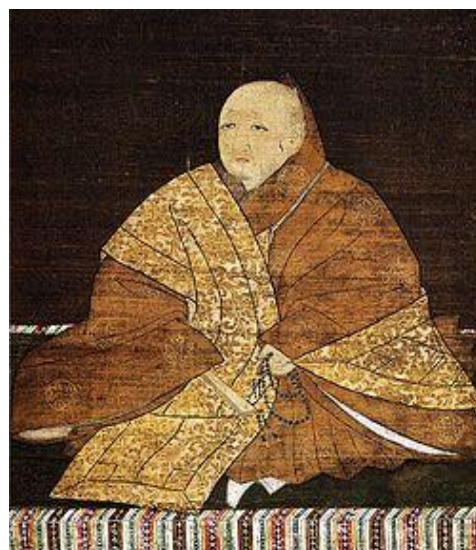
足利義満像（鹿苑寺蔵）

応安元年（正平 23 年、1368）4 月、将軍足利義満が元服すると、管領細川頼之（1329-1392）が実権を握った。応安 6 年（文中 2 年、1373）、細川頼之は天野合戦で勝利すると南朝の臨時首都天野行宮を陥落させる。しかし、橋本正督の鎮圧（橋本正督の乱）に失敗したことから、康暦元年（天授 5 年、1379）初頭に失脚してしまう。細川頼之を失脚させた足利義満は、明德 2 年（元中、1392）には、日本の六分の一を領有し将軍家に迫る勢力を持ちつつあった山名氏を討ち（明德の乱 30 ）中央集権化を進めていった。