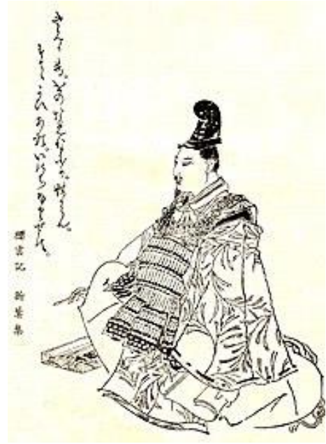
宗良親王 (菊池容斎『前賢故実』)

(1311-1385?) に代えている。これをうけて、新田義興 25 (1331-1358)・脇屋義治 26 (1323-?)・北条時行らが宗良親王を奉じて挙兵し鎌倉に進軍した。鎌倉にいた尊氏は一旦武蔵国まで引いたため、同 18 日には南朝方が一時的に鎌倉を奪回した。しかし尊氏は武蔵国の各地緒戦で勝利し、3 月までに新田義宗は越後、宗良親王は信濃に落ち延び、鎌倉は再び尊氏が占領した。一方関西では、閏 2 月 19 日、北畠親房の指揮下、楠木正儀(?-1388)・千種顕経(?-1377?)・北畠顕能(1326?-1383?) を始めとする南朝方が京都に進軍、翌日には七条大宮付近で義詮・細川顕氏(?-1352)らの軍勢と戦うと、義詮を近江に駆逐して入京した。北朝の光厳・光明・崇光の 3 上皇と皇太子直仁親王を南朝方本拠の賀名生へ移し、南朝の後村上天皇は行宮を賀名生から河内国