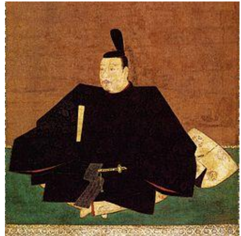
絹本著色伝足利尊氏像（浄土寺蔵）

翌元弘4年（1334）1月、後醍醐天皇は護良親王・成良親王・義良親王など男女合わせて36人いた子供の中から11歳の恒良親王（後の北陸朝廷天皇、1325-1346以降？）を皇太子に定めると、翌週に年号を「建武」と改めている。更に同月、鎌倉初期の承久元年（1219）に焼失してから再建されていなかった大内裏の再建を發議し、全国の地頭・御家人から年貢の20分の1を徴収することを決めている。更に3月には「楮幣」 4 とよばれる新紙幣と「乾坤通宝」という貨幣の発行詔書が発行されている。古代日本では「皇朝十二銭」 5 と呼ばれる銅銭が造られていたが普及することとはなく、10世紀半ば以降は中国からの輸入に頼っていた。これらの政策を実現するために、諸国の本家職と領家職 6 を廃することなどで財政の確保に取り組んだ。しかし、大内裏の再建や紙幣