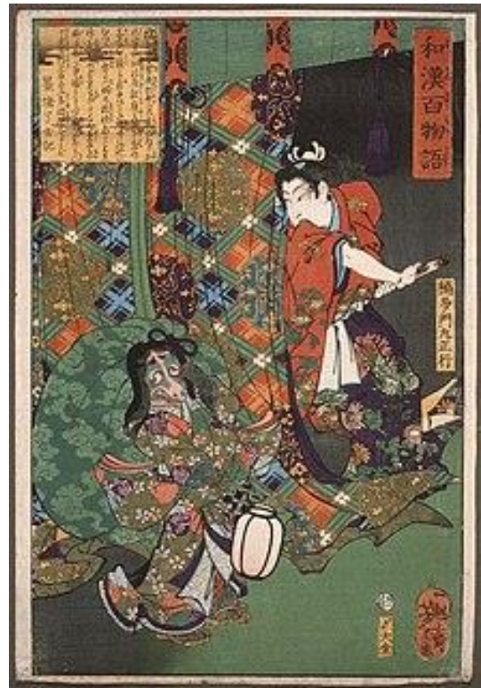
狸の妖怪を退治する若き楠木正行。月岡芳年『和漢百物語』

足利直義に替わって、鎌倉にいた尊氏の嫡男・足利義詮 よしあきら （1330-1367）を京都に戻し政務統括者とし、義詮の代わりに義詮の弟・基氏 もとよし （1340-1367）を鎌倉に下向させ初代鎌倉公方 22 としている。同年11月に義詮が入京すると12月には直義は出家して惠源と号した。ところが同月、上杉