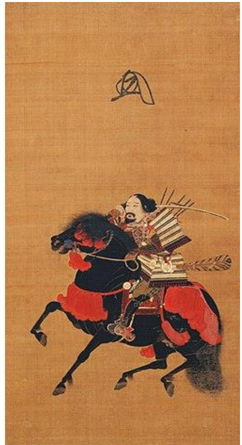
高師直像（足利尊氏像とも）

建武 4 年（延元 2 年、1337）12 月、南朝の鎮守府大將軍北畠顯家は、杉本城の戦いで斯波家長（1321-1338）を破り鎌倉を征服すると、翌年 1 月、美濃国青野原の戦いで土岐頼遠（?-1342）を破り京都にむかった。しかし、北朝方主力が近江国から美濃に入ったことを知った顯家は伊勢国に逃れる。2 月 21 日に大和国を占領したものの、7 日後に般若坂の戦いで北朝方桃井直常（?-1376） 18 に敗れて敗走する。青野ヶ原の戦いに伊勢から駆けつけていた顯家の弟、北畠顯信（1320?-1380?）の軍勢は男山に入り、顯家は義良親王を吉野へ送った後、天王寺に兵を集結させる。3 月に劣勢となっていた顯信を救援するため一部の兵を差し向けたことで寡勢となっていた顯家の軍は、5 月 6 日、石津・堺浦を焼討にすると細川顯氏（?-1352）・日根野盛治（?-?）ら北朝方勢力と交戦を続けた。これに対して男山で北畠顯信と対峙していた高師直（?-1351）・師泰（?-1351）兄弟は、兵の一部を率いて北畠顯家討伐に向かい、北朝方についた瀬戸内海水軍と共に北畠顯家を包囲した。吉野に逃げようとしたが落馬し討ち取られ、名和義高（1302-1338）・南部師行（?-1338）ら有力武将も戦死し、南朝