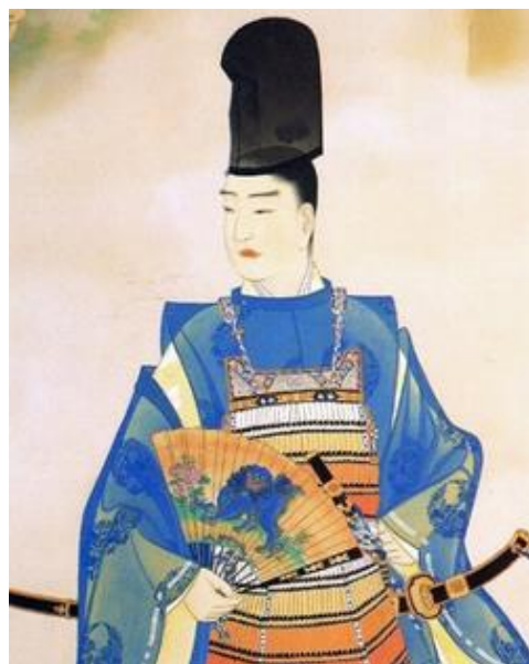
北畠顕家（靈山神社蔵）

この時、鎌倉幕府討伐の功労者である武者所所司新田義 貞が、足利尊氏が謀反を企てっていると後醍醐天皇に讒言 したといわれる。これに対して尊氏は、関東にあった新 田氏の領地を没収すると、後醍醐天皇に新田義貞討伐を 要請する。しかし、後醍醐天皇はこれを拒絶すると、新 田義貞に足利尊氏追討を命じて出陣させた。謀反人とされた足利尊氏は寺に籠り恭順の意を示したが、弟の足利直義は新田義貞を迎え撃った。弟の苦戦を聞いた足利尊氏は挙兵し、建武 2 年（1335）12 月、新田軍を箱根・竹ノ下の戦いで破ると、翌建武 3 年（1336）1 月に入京する。後醍醐天皇は比叡山へ避難するが、奥州から西上した北畠顕家が新田義貞と合流し、京都の足利軍を駆逐する。九州へ落ち延びた足利軍は、肥後の多々良浜の戦いで菊池武敏率いる大軍を打ち破ると九州の大半を味方につけ再び東上した。足利軍は、持明院統の光厳上皇（1313-1364）の院宣を得ることで反乱軍から討伐軍へと立場を変え、5 月に湊川の戦いで楠木正成を討ち取ると、光厳上皇を奉じて入京した。後醍醐天皇は再び比叡山に逃れるが、千種忠顕（ ちくさただあき ?-1336）・名和長年・結城親光ら重臣が次々と討ち死した。尊氏は光厳上皇の弟豊仁親王（1322-1380）を光明天皇として即位させると、後醍醐天皇に退位を求めた。9 月、後醍醐天皇は皇子の懐良親王（ かほよし 1329-1381） 16 を征西大將軍に任じて九州へ派遣し、10 月には新田義貞に恒良・尊良親王を奉じさせて